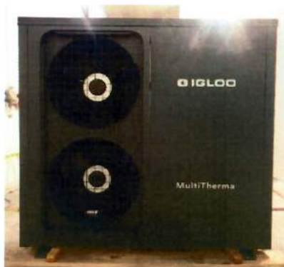
Fot. 1-2 Pompa ciepła przed modyfikacją obudowy – badania zgodnie z PN-EN 14825:2019-03 Photo 1-2 Heat pump before housing modification – tests in accordance with PN-EN 14825:2019-03