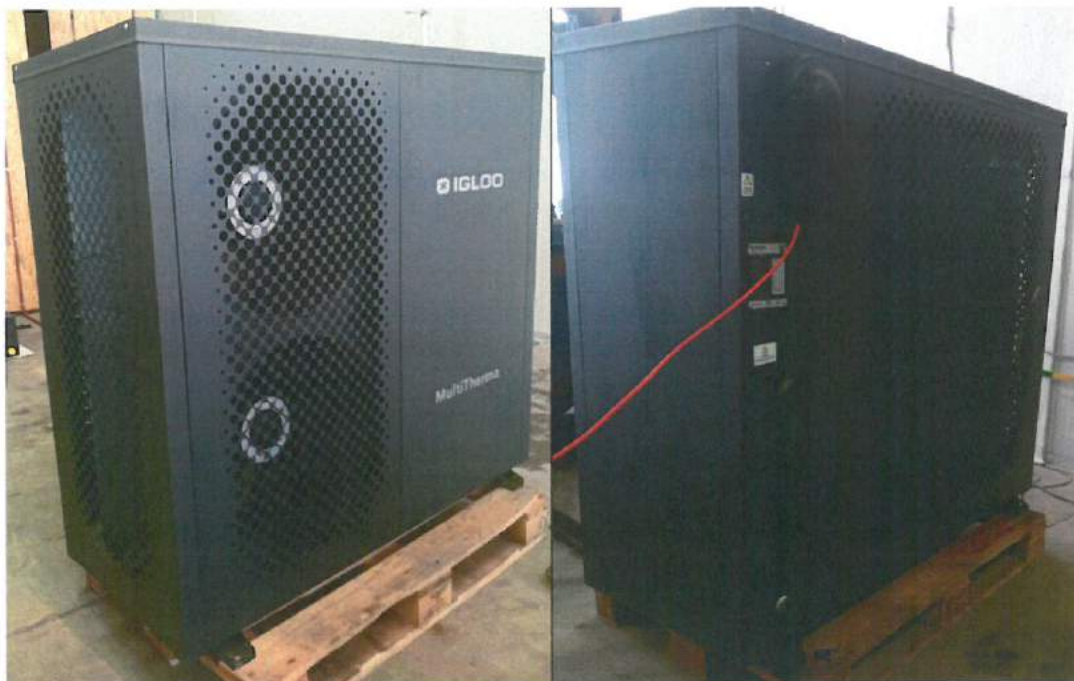
Fot. 5-6 Badana pompa ciepła przed badaniami poziomu mocy akustycznej Fot. 5-6 Tested heat pump before sound power tests

Specyfikacja obiektu zgodnie z punktem 1 niniejszego protokołu. Dokumentacja zdjęciowa poniżej. Specification of the test object in accordance with point 1 of this report. Photo documentation below