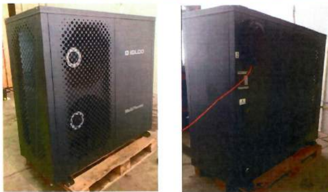
Fot. 3-4 Pompa ciepła po modyfikacji – badania zgodnie z PN-EN 12102-1:2022-11 Photo 3-4 Heat pump after modification – tests in accordance with PN-EN 12102-1:2022-11

For testing the sound power level in accordance with PN-EN 12102-1:2022-11, the device housing has been modified (Photo 3-4). The test results included in Table 2 refer to the modified device (Photos 3-4), while the results presented in Table 1 refer to the device before the modification (Photos 1-2).