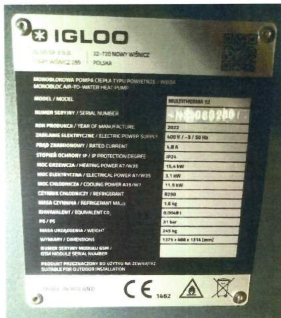
Fot. 1 Błędna tabliczka znamionowa Photo 1 Incorrect nameplate

Zgodnie z deklaracją producenta urządzenie dostarczone do badań oznakowane zostało błędną tabliczką znamionową (Fot. 1), nową tabliczkę dostarczoną przez producenta w czerwcu 2023 r. przedstawiono na Fot. 2 According to the manufacturer's declaration, the device delivered for testing was marked with an incorrect nameplate (Photo 1), the new nameplate delivered by the manufacturer in June 2023 is shown in Photo. 2