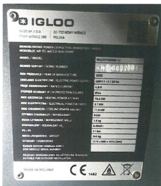
Fot. 1 Błędna tabliczka znamionowa Fig. 1 Incorrect nameplate

Zgodnie z deklaracją producenta urządzenie dostarczone do badań oznakowane zostało błędną tabliczką znamionową (Fot. 1), nową tabliczkę dostarczoną przez producenta w czerwcu 2023 r. przedstawiono na Fot. 2 According to the manufacturer's declaration, the device delivered for testing was marked with an incorrect nameplate (Photo 1), the new nameplate delivered by the manufacturer in June 2023 is shown in Photo. 2