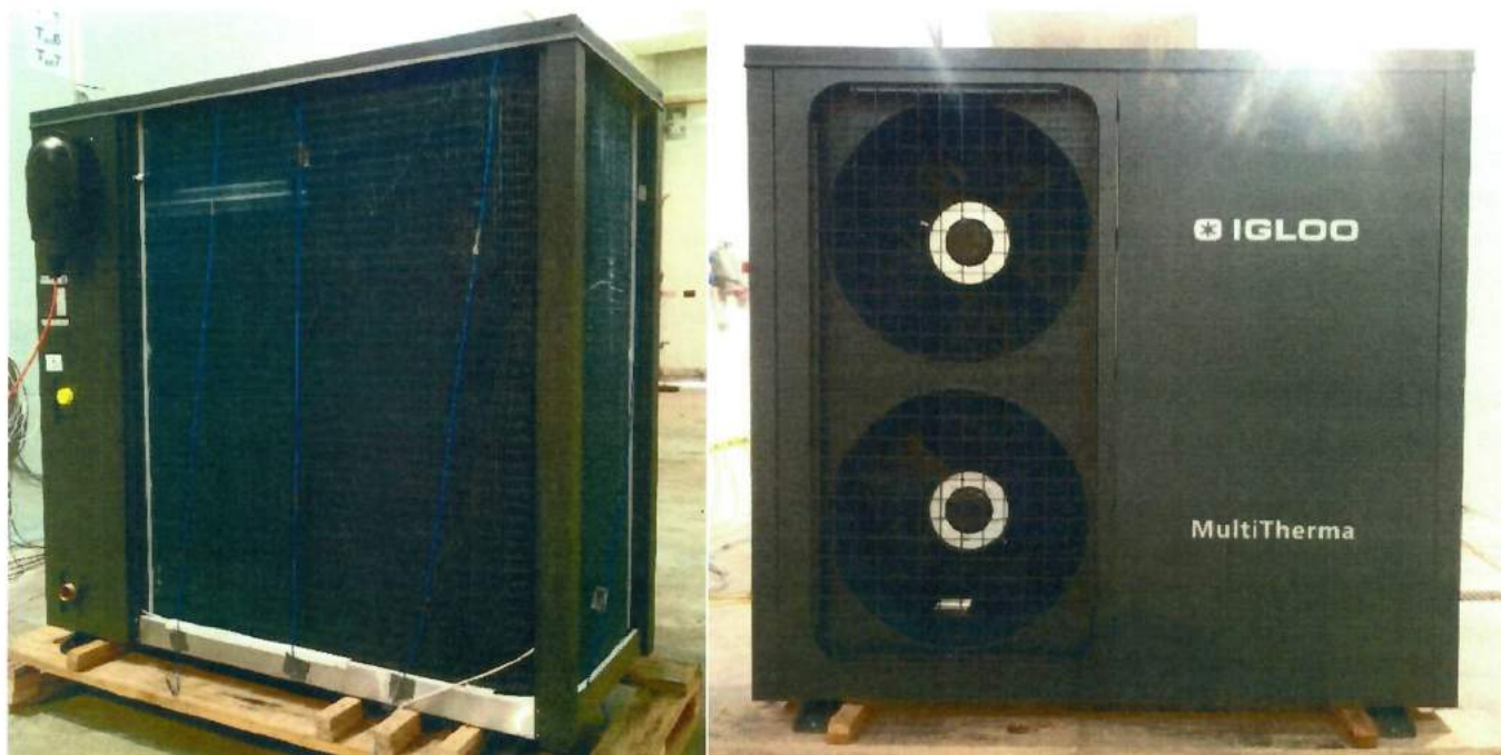
Fot. 3-4 Badana pompa ciepła przed badaniami wydajności i eksploatacyjnymi Photo 3-4 Tested heat pump before performance and operational tests