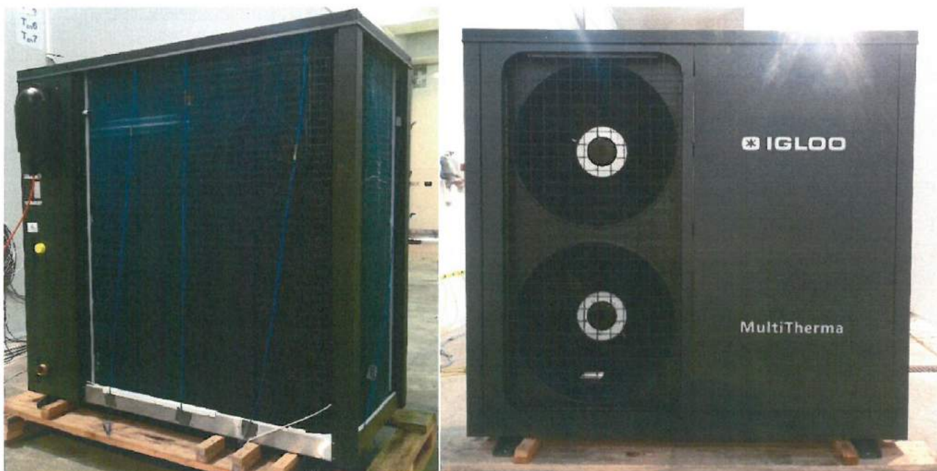
Fot. 3-4 Badana pompa ciepła przed badaniami wydajności i eksploatacyjnymi Fot. 3-4 Tested heat pump before performance and operational tests

Specyfikacja obiektu zgodnie z punktem 1 niniejszego protokołu. Dokumentacja zdjęciowa poniżej Specification of the test object in accordance with point 1 of this report. Photo documentation below